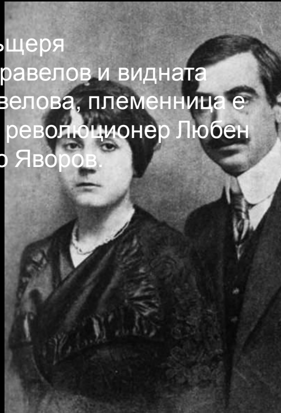
Лора Каравелова и Пейо Яворов

Лора Петкова Каравелова е дъщеря на българския политик Петко Каравелов и видната общественичка Екатерина Каравелова, племенница е на големия български писател и революционер Любен Каравелов и жена на поета Пейо Яворов.