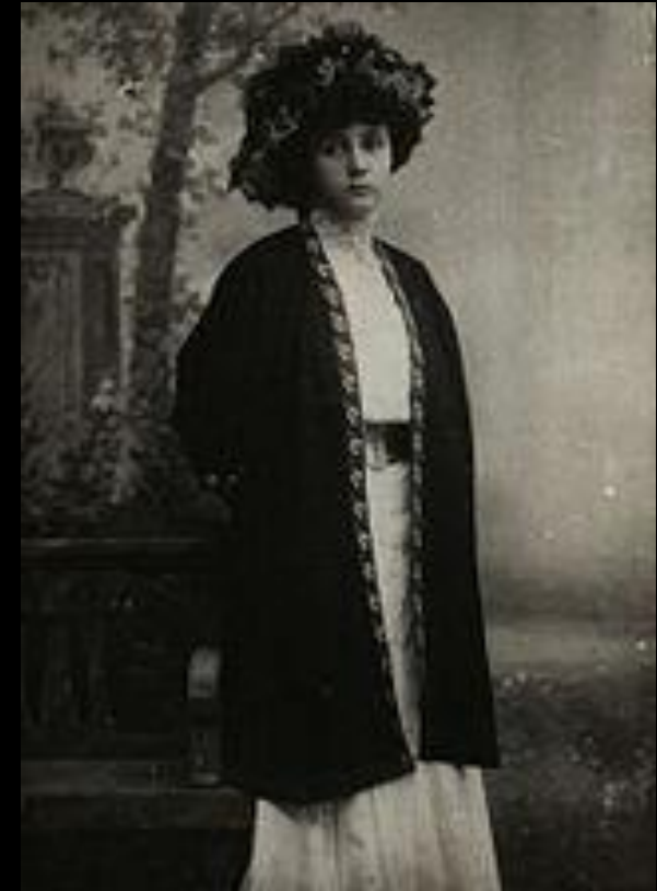
Лора Каравеловшва 1911година