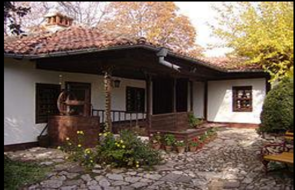
Къща-музей на Яворов в Чирпан